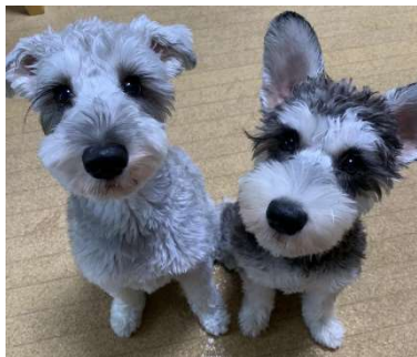
小羽君と音羽ちゃん

私の家族の中にミニチュアシュナウザー二匹増えました！ 少し臆病…でもとてつもなく優しいBOYと運動神経抜群のやんちゃなお茶目Girlですが、二匹の相性はなかなか良いのです。 実は犬を飼う事に10年悩みました。元々動物が大好きで調教師を目指していたことも有るほど。しかし愛猫・愛犬との別れが辛すぎて立ち直れないことへの怖さがありました。 しかし、別れを経験する恐怖心より、やはり犬と一緒に暮らしたい！という気持ちがあふれたのが10年悩んだ末の去年でした。動物から貰えるエネルギーって素晴らしい！疲れている時にそっと寄り添ってくれるBOY。かまってほしくて常に後追いつてくるGirl。私のエネルギーチャージはこの子達から。もう最高です♪出会えたことに感謝！ (井川)